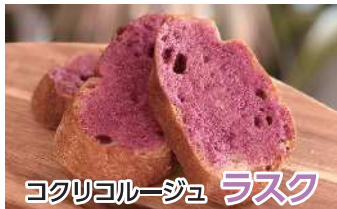
ココリコルーージュ ラスク

昨年度好評いただいたエイドを今年も実施! ハーフマラソン、5キロのコース上にエイドステーションを設置します!