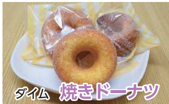
タイム 焼きドーナツ